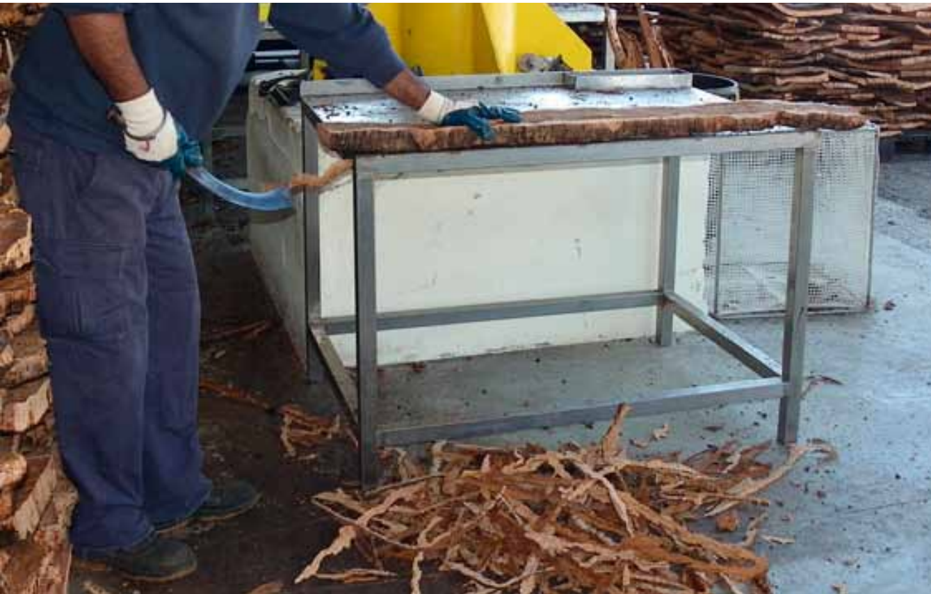
Fotografia 15. Retall de les rebaves