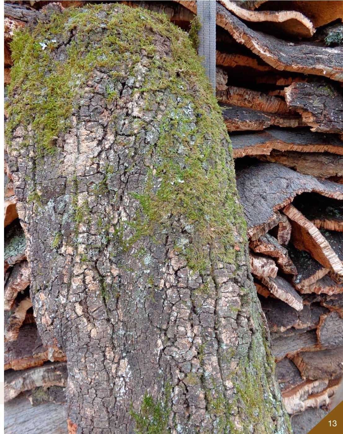
Fotografia 12. Panna de suro recoberta, en part, per molsa verda i amb presència de taca groga