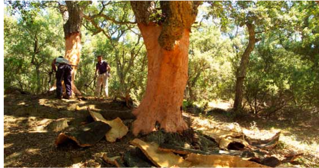
Fotografia 5. Pela del suro

La millora en el procés de preparació i l'impuls a la compra de suro català ajudaria a assolir un altre objectiu important com és la millora de les suredes de Catalunya, gràcies a l'aprofitament del suro i la gestió forestal sostenible d'aquestes masses, en el que hi estan involucrats tant propietaris forestals, com empreses de treballs forestals i rematants. Per altra banda, proveir-se de suro català pot ajudar a disminuir el risc d'incendis, combatre el canvi climàtic, fixar carboni, i també pot contribuir a la consolidació de llocs de treball en zones rurals.