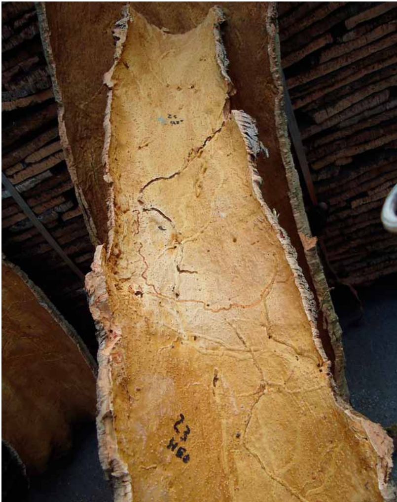
Fotografia 11. Panna amb molta presència de galeries realitzades pel corc del suro

A continuació es descriuen les pràctiques recomanades per a l'obtenció de pannes aptes per elaborar taps de suro natural.