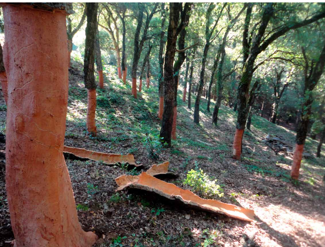
Fotografia 1. Sureda en producció havent acabat de pelar el suro

Actualment, s'extreuen entre 3.000 i 4.000 tones anuals de suro majoritàriament a les comarques gironines, tot i que el potencial productiu de suro a Catalunya es xifra en unes 8.000 tones anuals. Segons dades d'APCOR, a Catalunya es produeix prop del 2% del suro mundial (veure figura 1).