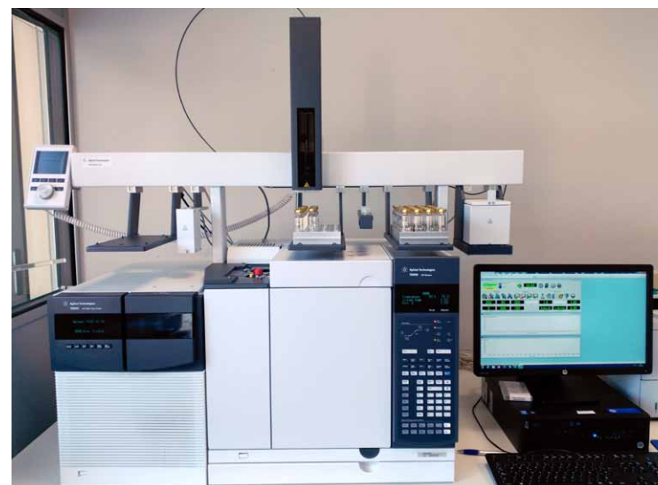
Fotografies 7-10. Assaigs físics, químics i sensorials realitzats als taps de suro català