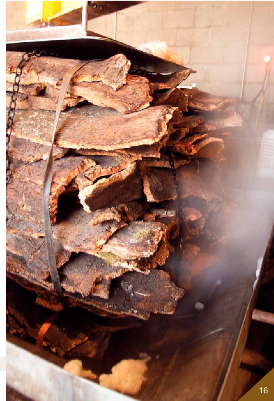
Fotografia 14. Procés de bullit