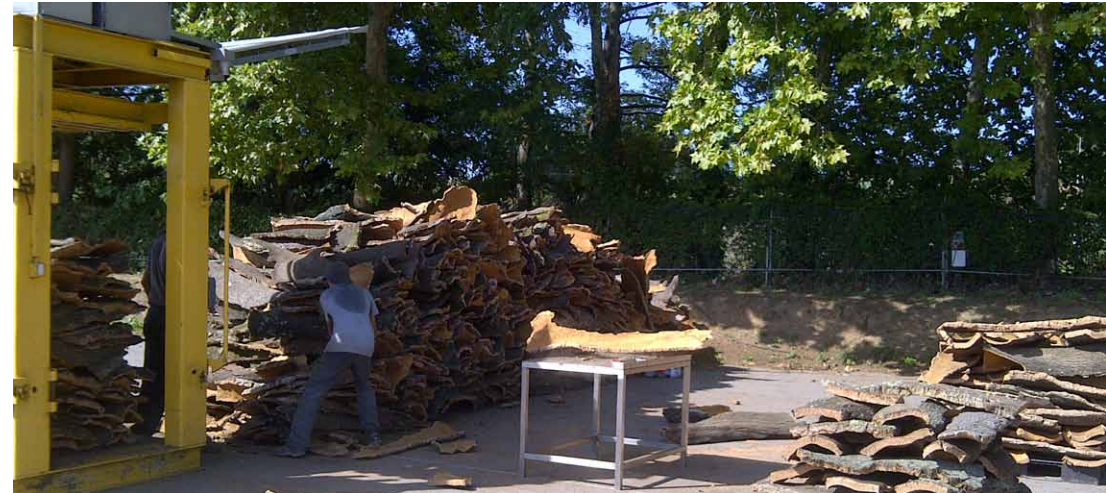
Fotografia 6. Tria i preparació del suro